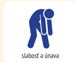
slabosť a únava